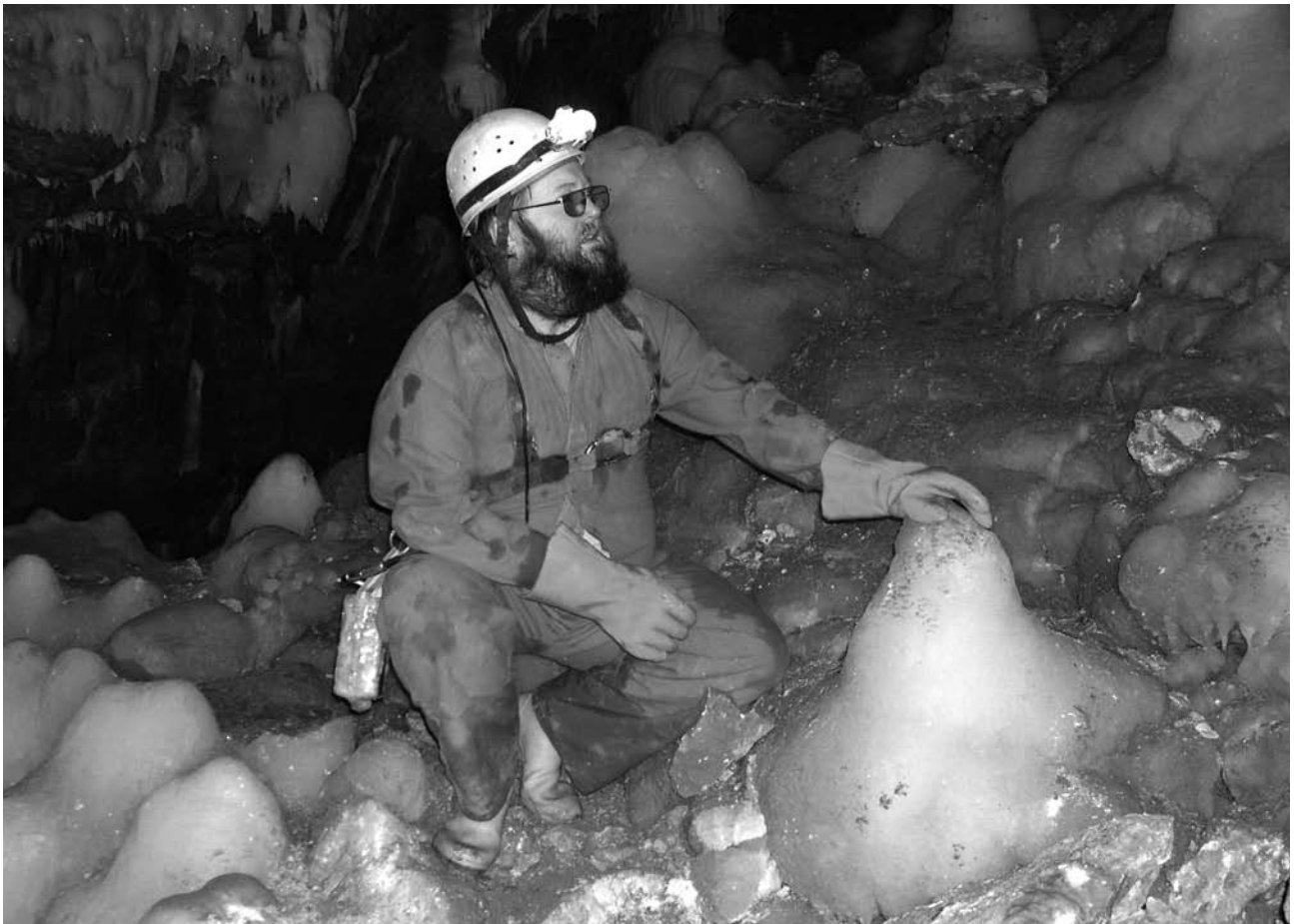
Abb. 2: HU in die Zaininger Höhle bei seiner letzten Höhlentour an seinem 47. Geburtstag am 28.12.04

Achim Gulde Oberhof 130 1/2 87471 Durach agulde@web.de